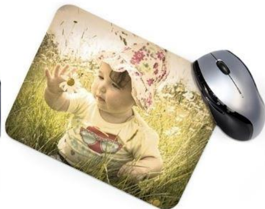
Vintage 3 : Bords assombris, ton sépia clair