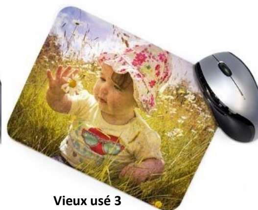
Vieux usé 3