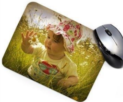
Vintage 2 : Bords assombris, ton chaud