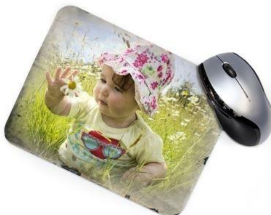
Vintage 5 : Bords usés, photo au centre couleur original

Le vintage : Des effets toujours appréciés.