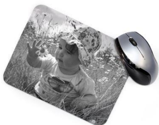
Noir et Blanc