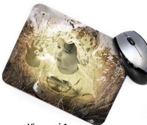
Vieux usé 1