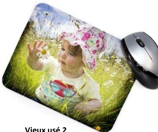
Vieux usé 2