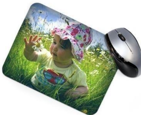
Vintage 1 : Bords assombris, ton froid