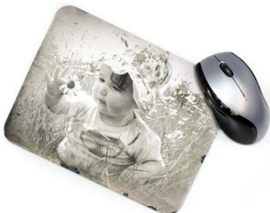
Vintage 4 : Noir et Blanc avec bords usés